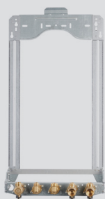
Fácil substituição Suporte montagem

Apresentam dimensões reduzidas, bem como ligações eletrónicas fáceis e acessíveis sem a necessidade de retirar a carcaça, uma vez que está equipada com um mecanismo robusto para a rebater, o que permite a instalação da caldeira dentro ou entre armários de cozinha.